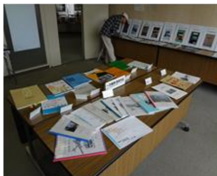
作品展示コーナー