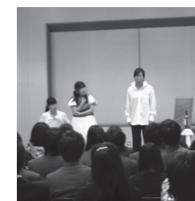
桜丘高等学校 豊橋中央高等学校 豊橋東高等学校