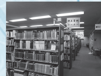
豊橋や近くの地域のことを知る(郷土資料)