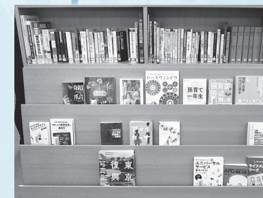
新刊、話題の本の紹介