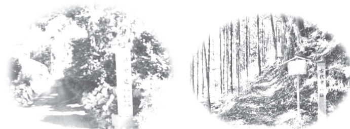
姫街道(豊橋市嵩山町)