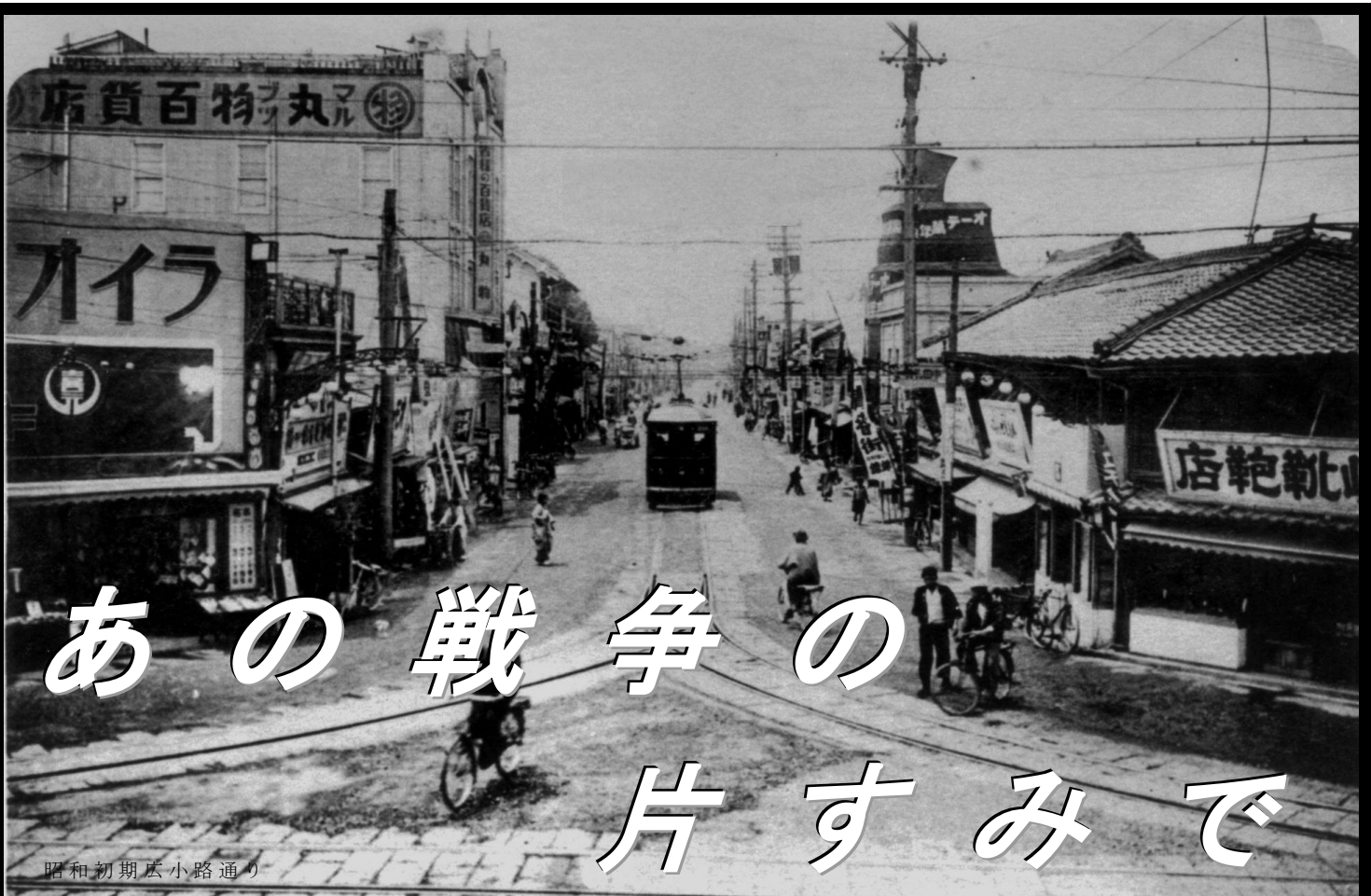
昭和初期広小路通り