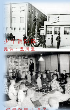
少年消団隊

開館時間 9:30～19:00 ※金は21:00、土日祝は17:00まで 休館日 7/10・18・24・28・31 8/7・14・21・25 ところ 豊橋市中央図書館 2階展示コーナー 問い合わせ 豊橋市中央図書館 (0532-31-3131) 〒441-8025 豊橋市羽根井町 48番地