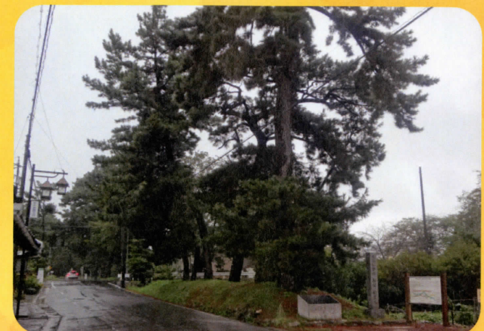
東海道 御油の松並木(豊川市御油町)