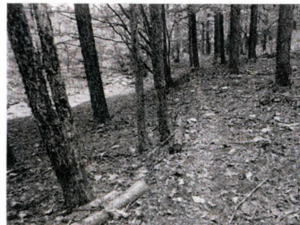
川沿いの整備された秋葉古道 (長野県下伊那郡大鹿村)

他にも古道を復活させ地域おこしの手段にしたり、りんごや夏みかんの並木づくりを教育に生かしたりしている姿を紹介します。