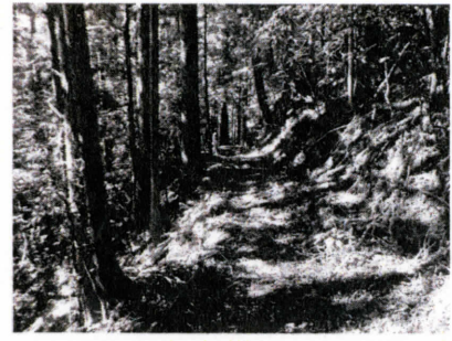
・愛知県北設楽郡設楽町