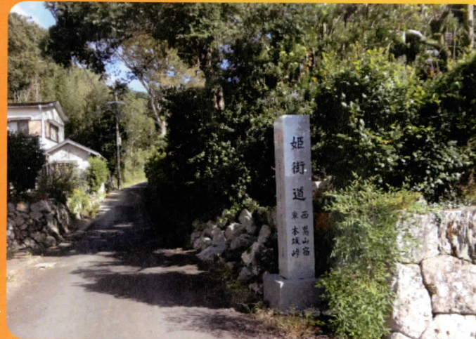
姫街道(豊橋市嵩山町)