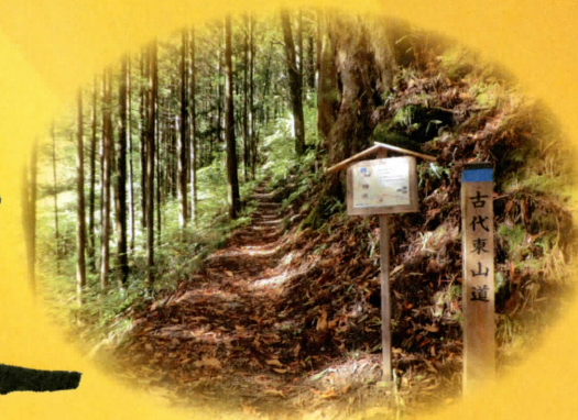
東山道(長野県阿智村)