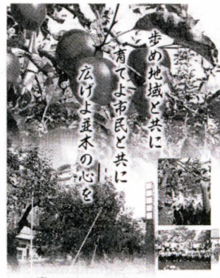
りんご並木リーフレット