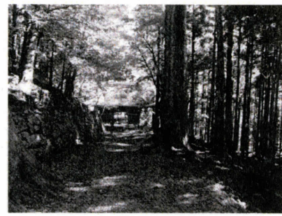
・静岡県浜松市天竜区秋葉山