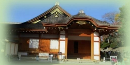
名古屋城本丸御殿