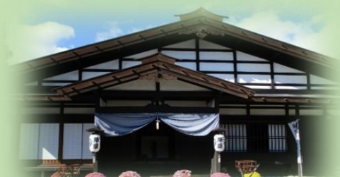
飯島陣屋(長野県飯島町)