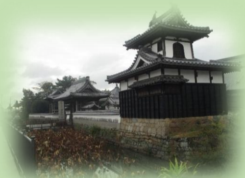
城郭寺院・本證寺(安城市)