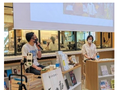
【「館長がいま会いたいひと」での対談の様子】

まちなか図書館では様々なイベントを開催しています。毎月発行しているチラシや、まちなか図書館ホームページをチェックしてみてください。