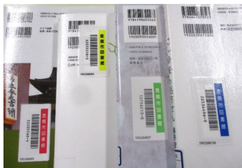
【左から、赤（大清水）、黄（まちなか）、緑（中央）、青（向山）】

バーコードの色によって、本を所蔵している図書館を判別することができます。バーコードの番号はひとつひとつ違い、その資料の情報がわかるようになっています。