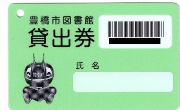
【豊橋市図書館 貸出券】

豊橋市図書館の貸出券は、0歳から作ることができ、手続きには、住所・氏名・生年月日が確認できるものが必要です。豊橋市の4つの図書館、ネットワークでつながった8つの分室のカウンターで受け付けています。