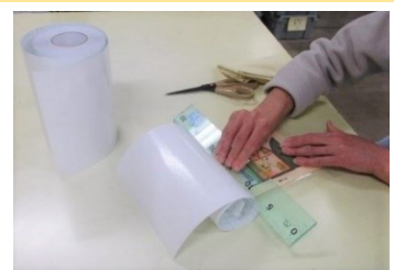
【透明フィルム（通称：ブッカー） をかける様子】

製造企業のホームページによると、透明フィルム（通称：ブッカー）の効果には、紫外線・水分・汚れから本を保護するほか、抗菌作用などもあるそうです。一般向けに市販されているものもあります。