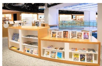
【まちなか図書館の配架】