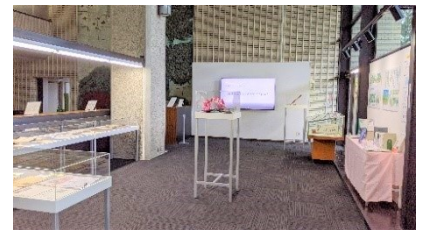
【情報発信コーナー（中央図書館1階）】

情報発信コーナーは、開館時は喫茶スペース、電子情報コーナーを経て、令和2（2020）年6月に図書館として情報発信力を強化するために開設されました。このコーナーでは、図書館の豊富な資料や情報を活用し、その時々話題や郷土の身近な情報をテーマにパネル展示やミニ講座などを開催しています。