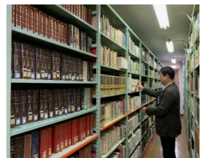
【閉架書庫（中央図書館2階）】

中央図書館の閉架資料は、2階カウンターへの申込み、またはWeb予約で利用できます。