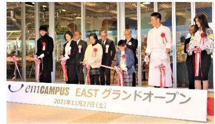
【まちなか図書館が入る emCAMPUS EAST のグランドオープンの様子】

昭和 58 (1983) 年 2 月 23 日は中央図書館、平成 27 (2015) 年 4 月 4 日は大清水図書館の開館年です。まちなか図書館は、令和 3 (2021) 年に開館した 1 番新しい図書館です。