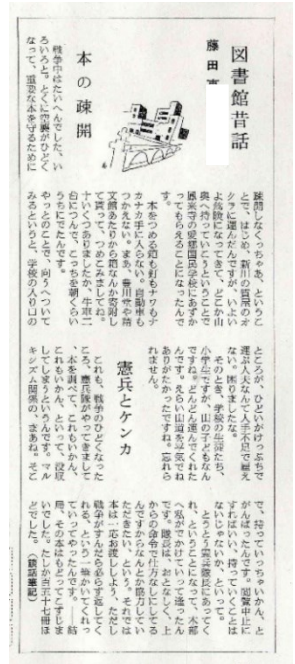
【『みんなの図書館』42号（昭和37.10.1）より】