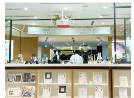
【ひとひとカフェの外観】

正解は、ひとひとカフェ。食事も提供しています。食事は 2 階の全フロアと 3 階のテラスでお楽しみいただけます。美味しい飲み物を片手に、ゆっくりと読書を楽しめます。