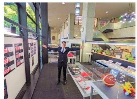
【「知の伝道師」第1号「三遠ネオフェニックス」の展示】

「知の伝道師」の取組みは、令和3（2021）年9月からスタートし、現在23組の幅広い分野の個人や団体、企業が登録しています。登録した方には、図書館主催のイベントや講座の講師のほか、関連展示の監修やおすすめ図書の選定などに協力いただいています。