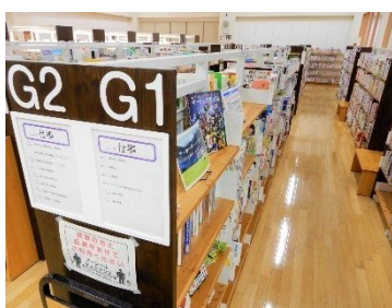
【大清水図書館の配架】

まちなか図書館では、「自分を磨く」や「演じるアート」など、これまでに触れる機会のなかった本と出会うため、独自のテーマを設定して本を並べています。中央図書館や大清水図書館でも、テーマごとに分けている棚があります。