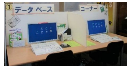
【データベースコーナー（中央図書館2階）】

豊橋市図書館が作成している新聞データベースでは、電子データ化された過去の新聞（主に地元紙）を見ることができます。その中には、明治時代の新聞も含まれており、のちに合併・改題して『中日新聞』になる『新愛知』や、現在は無くなっている地元紙『新朝報』などがあります。