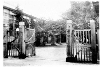
【初代図書館（花田町）】