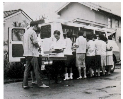
【自動車文庫「きぼう号」での貸出風景（昭和35年頃）】