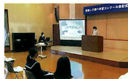
最優秀者による発表 (第7回表彰式)

※いずれも豊橋市中央図書館(予定) ※優秀な作品は全国コンクールに推薦し、その後は図書館の蔵書 になります。