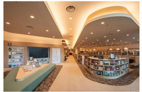
札幌市図書・情報館の館内