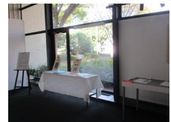
／前回の展示の様子／