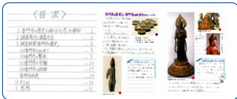
第6回中学生の部優秀賞