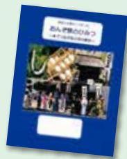
第6回 小学生の部最優秀賞

身近な豊橋の歴史や文化、 偉人について調べてみたい！ (例)豊橋筆や手筒花火 など