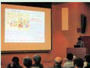
第6回発表会の様子