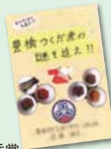
第6回 小学生の部優秀賞