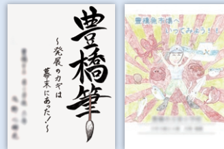
第8回小学生の部(優秀賞)