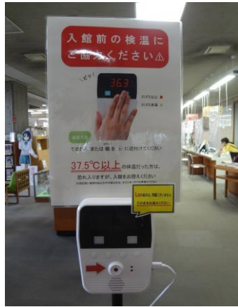
📷 写真は中央図書館の自動検温器です

体温が 37.5℃以上ある方は、入館をお控えください。ご理解とご協力をお願いいたします。