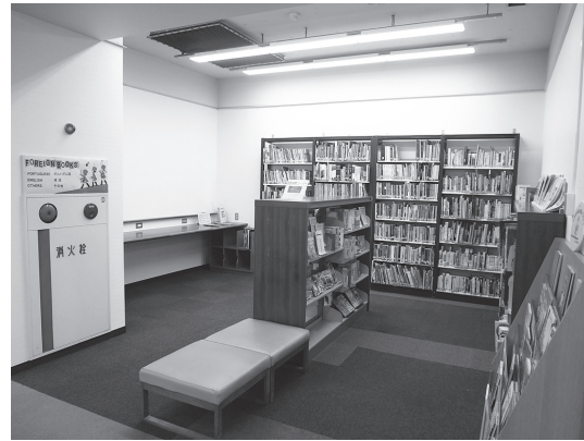
外国語図書コーナー（1階）

英語多読用の図書をはじめ、ポルトガル語、英語を中心に中国、韓国、ドイツ、フランスなど各国の言語で書かれた資料が3000冊余り並んでいます。文学作品のほか、暮らしの参考になる本、紙芝居、絵本を取りそろえていますので、外国語を母語とされる方はもちろん、他国の文化、言語に興味をお持ちの方もお気軽にご利用ください。