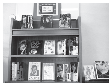
「懐かしの映画・俳優」コーナー