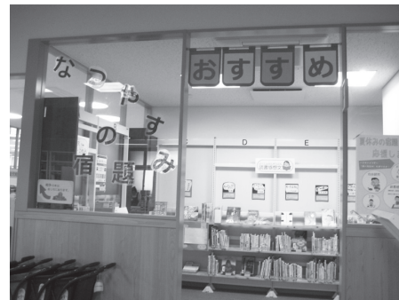
コーナーをつくりました！！